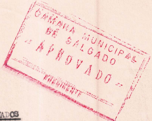
TABELA DE CARGOS COMISSIONADOS