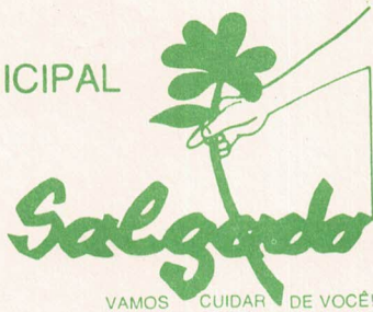
TABELA DE CARGOS COMISSIONADOS MES DE AGOSTO/92