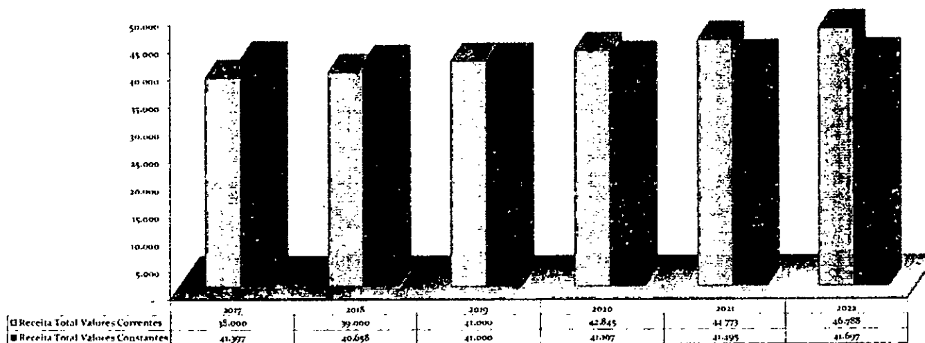
Valores Correntes x Valores Constantes